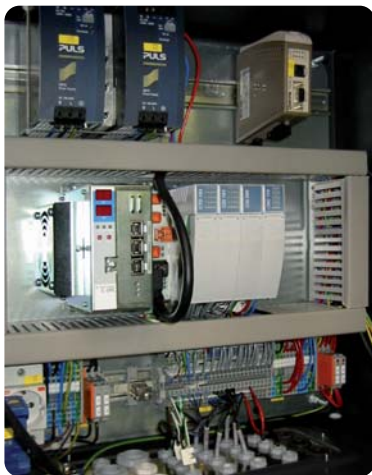
Bild 2: Das innovative Steuerungskonzept ist auf Basis der C-Dias-Technologie von Sigmatek realisiert. Durch Einsatz des hart-echtzeitfähigen Varan-Bus reicht eine einzige CPU aus, um alle Steuerungs- und Visualisierungsaufgaben zu übernehmen.