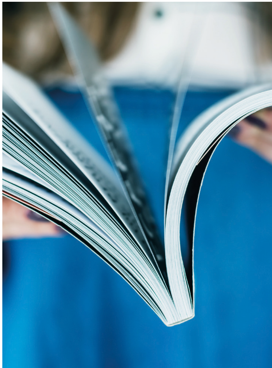
Langlebige und hochwertige Klebeverbindungen – auch auf anspruchsvollen Oberflächen